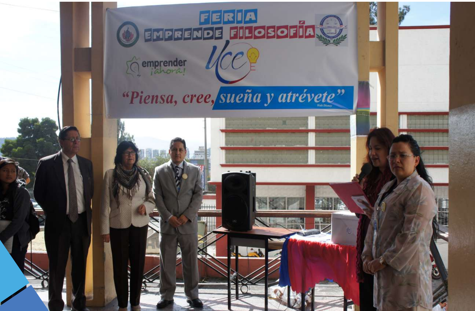
FOTO: Casa Abierta Feria de Emprendimiento.