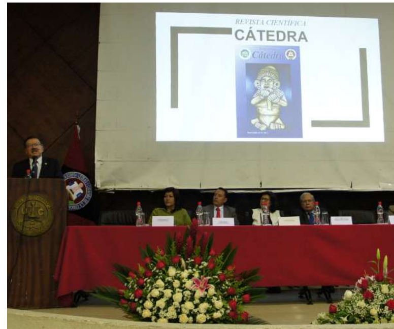
FOTO: Presentación del Primer Número de la Revista Cátedra