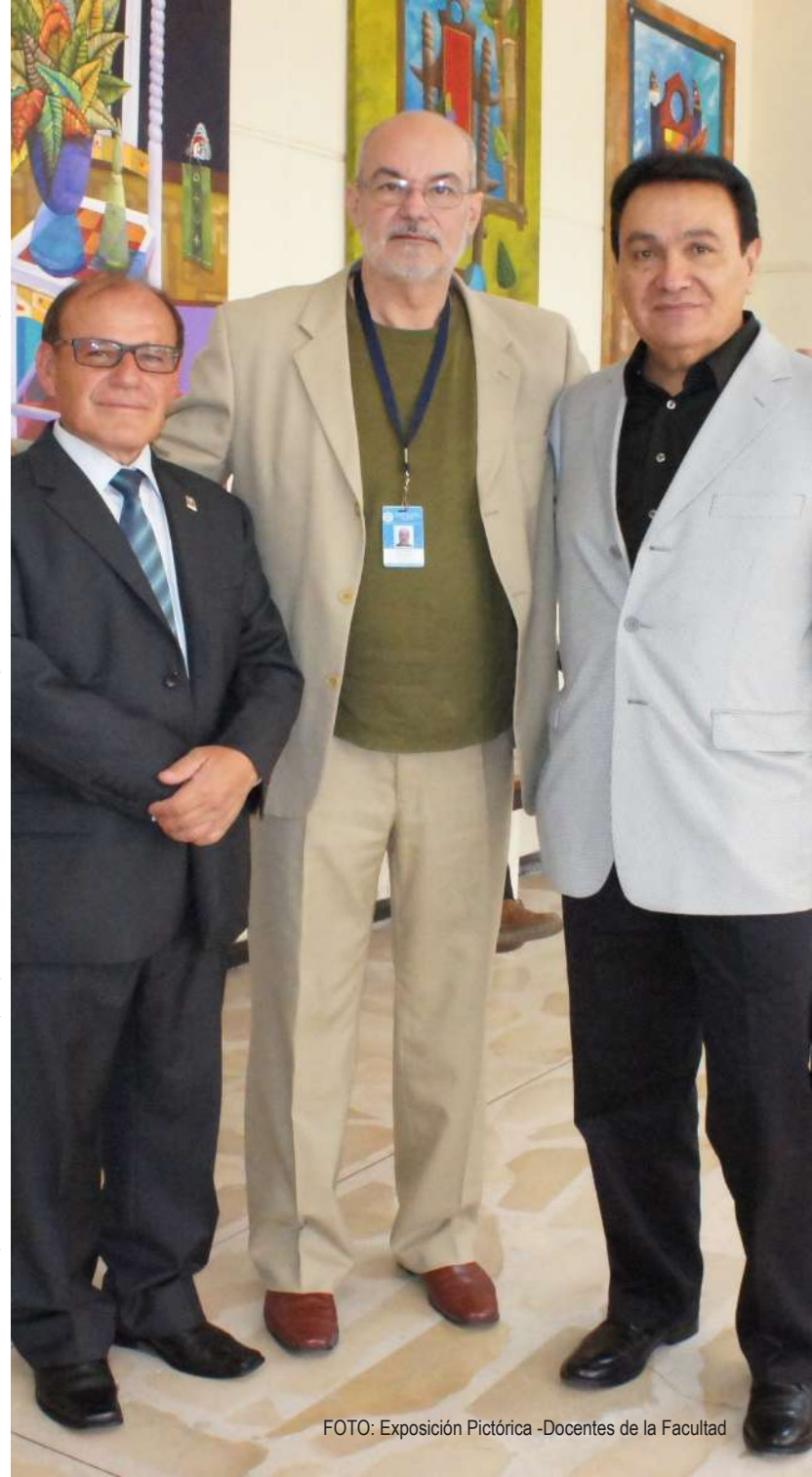
FOTO: Exposición Pictórica -Docentes de la Facultad