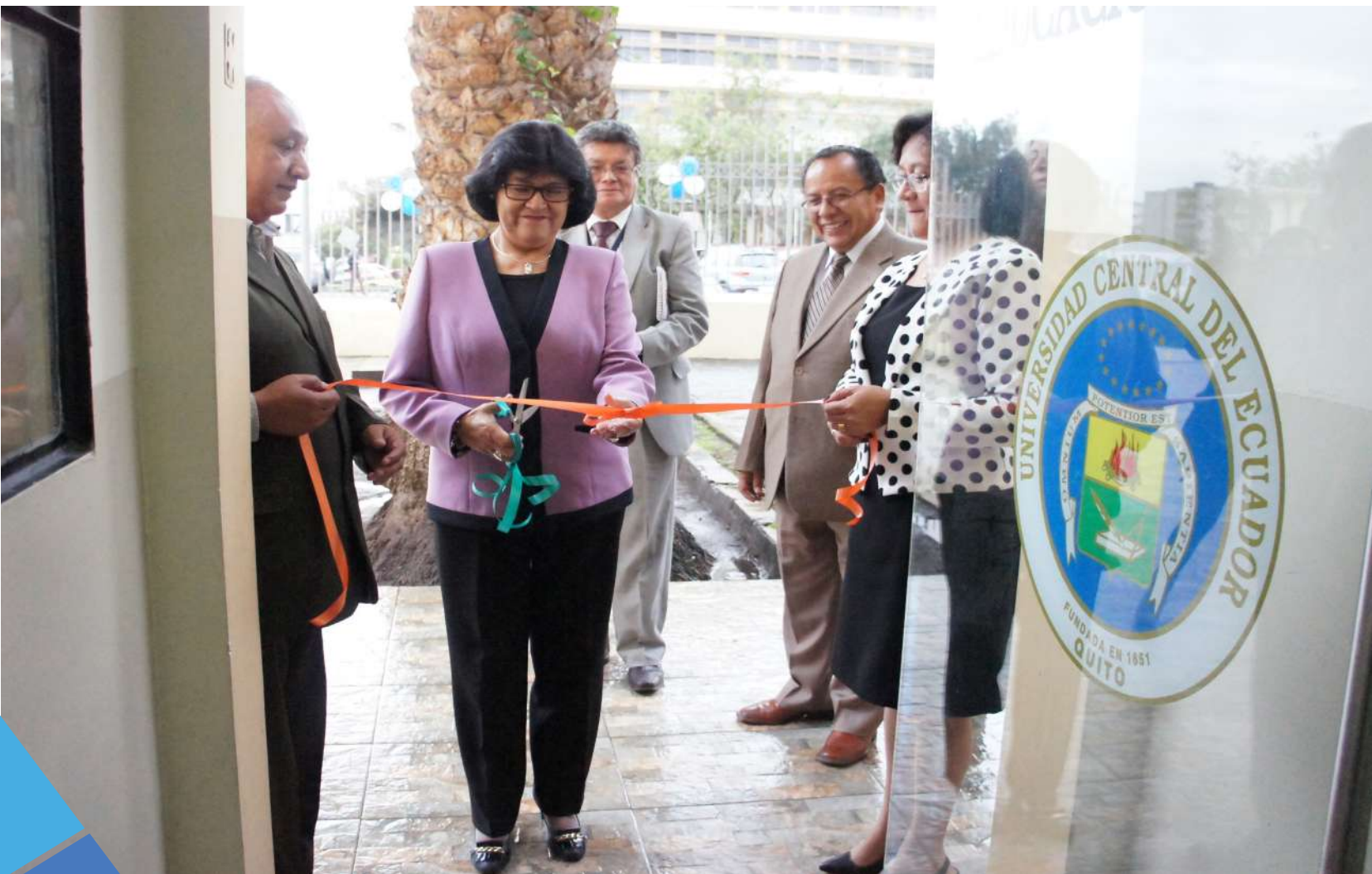
FOTO: Inauguración de la remodelación del edificio de la Carrera de Educación Inicial

INFRAESTRUCTURA, MANTENIMIENTO Y EQUIPAMIENTO