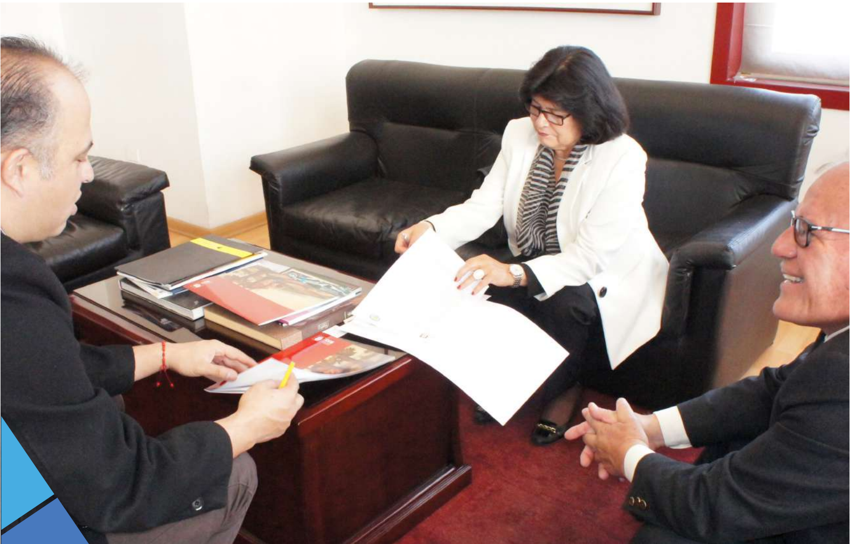
FOTO: Firma del Convenio- Casa de la Cultura Ecuatoriana