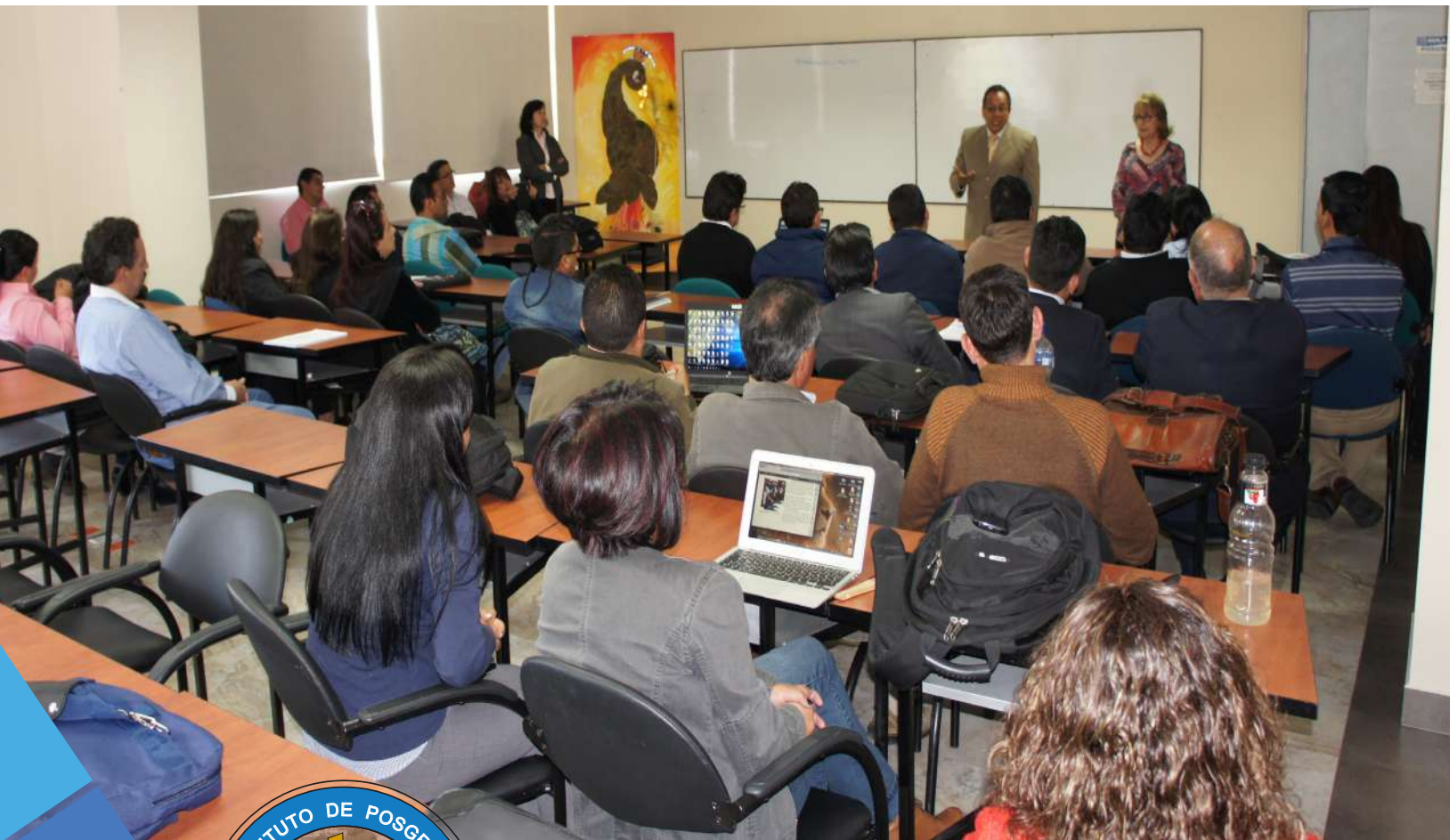
FOTO: Capacitación de tutores de Posgrado