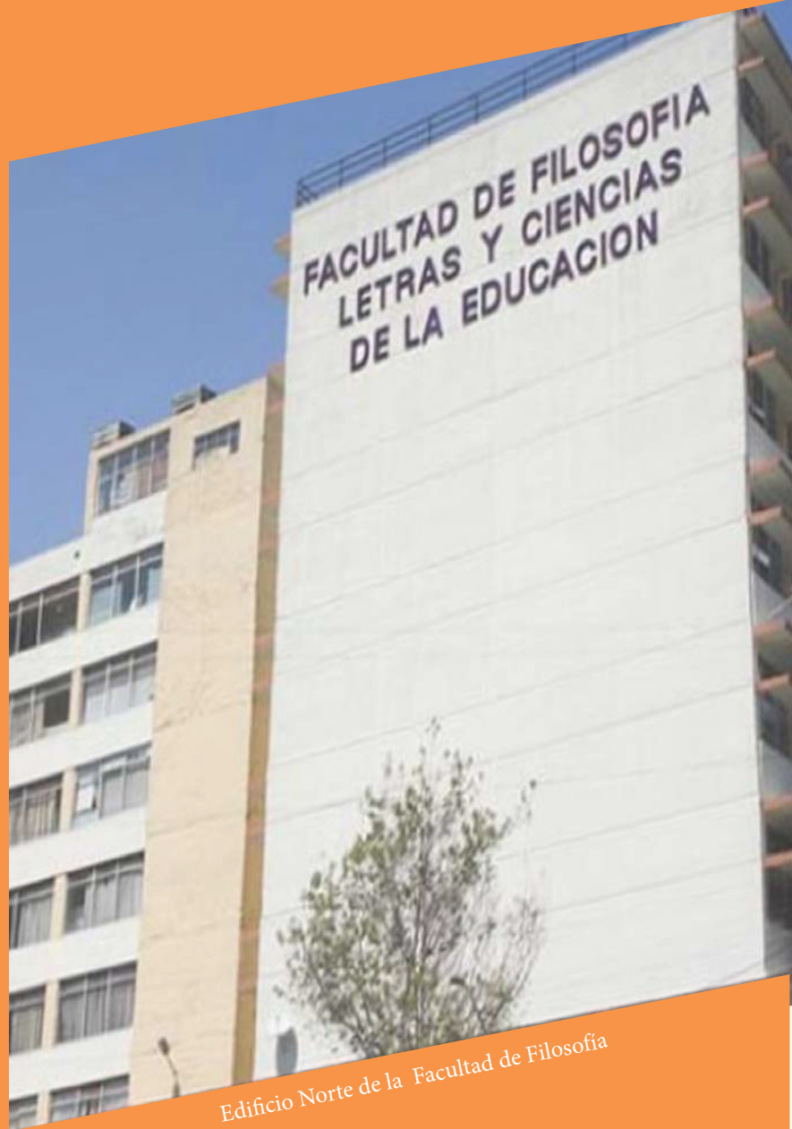
Edificio Norte de la Facultad de Filosofía