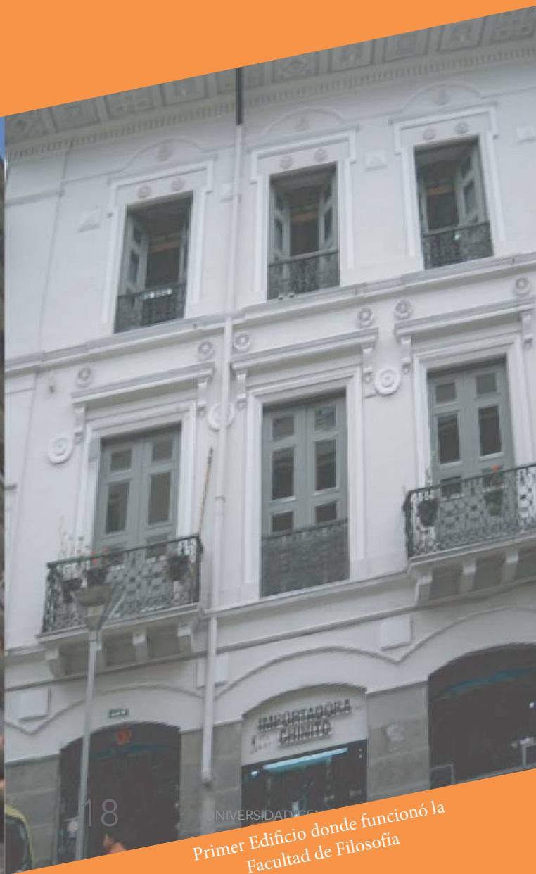
18 UNIVERSIDAD CE Primer Edificio donde funcionó la Facultad de Filosofía